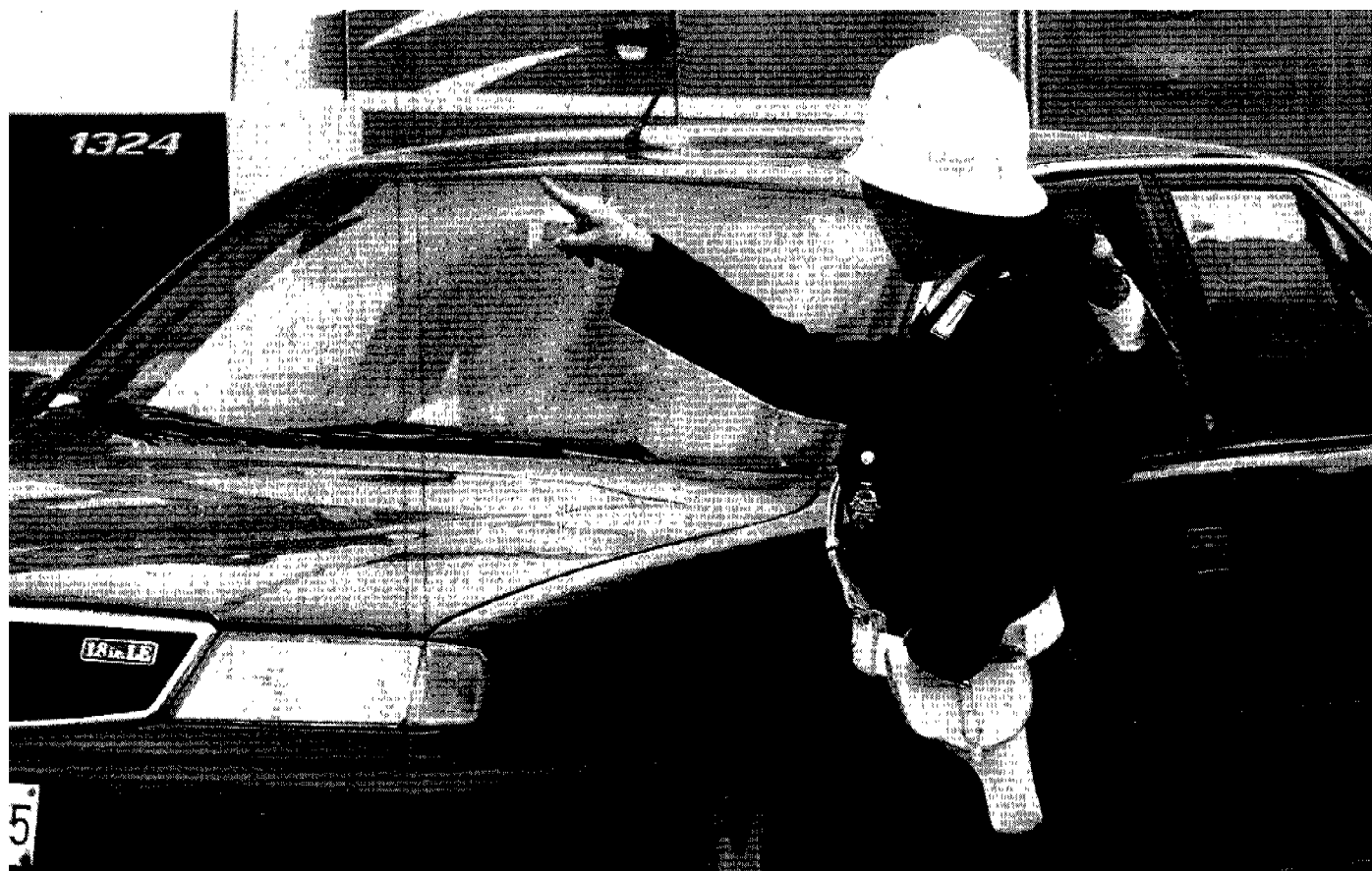
L'equipaggiamento. Nuove divise e sfollagente in dotazione ai vigili urbani; la proposta include anche corsi di autodifesa per gli agenti

Dal Pdl emendamento alla delibera comunale: preparazione fisica, divise «cattive» e sfollagente